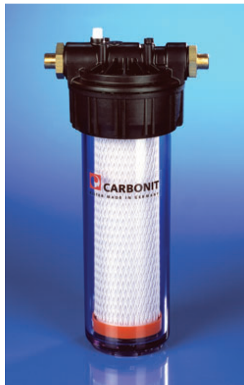
Schéma de montage VARIO Universel

Egalement utilisable sur des ballons d'eau chaude sans pression! A n'utiliser qu'avec de l'eau froide!