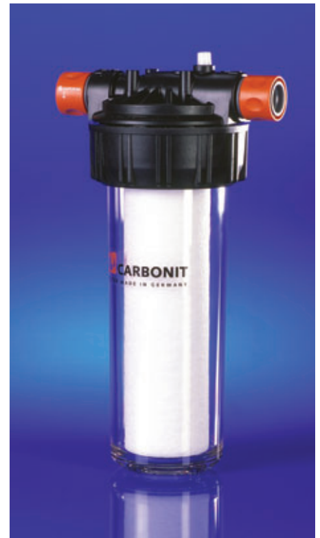
Abb. VARIO Puerto