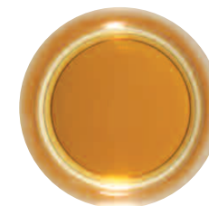
Avec Bellima®: un thé clair, pas de couche de film à la surface, pas d'arrière-goût amer, une saveur optimale